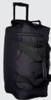
MALETIN CON RUEDAS