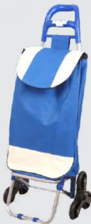
CARRITO DE COMPRAS